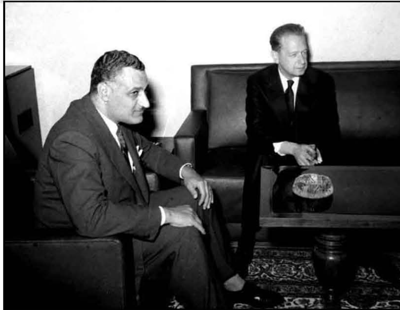
يستقبل داج هرشولد السكرتير العام للأمم المتحدة ١٩٥٧/٣/٢١